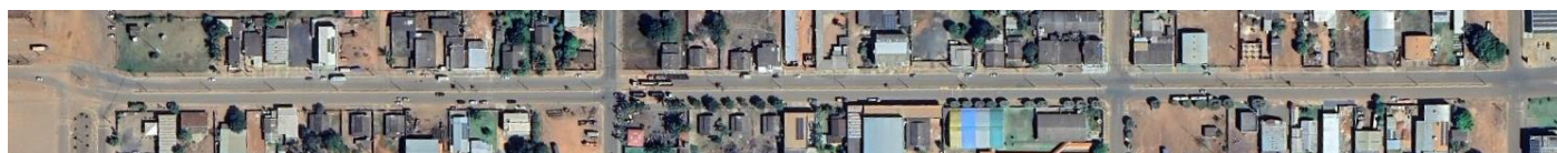
Imagem: localização do trecho do canteiro.

A obra em questão refere-se à Reforma do Reforma da Revitalização do canteiro e Implantação de ciclofaixa na Avenida Adelino José Zamo, Campos de Júlio-MT.